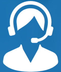
クラウド人事労務コモン

かしこまりました！それでは 「雇用契約書・保険手続き（※）」を ワンストップで対応させていただきますね。