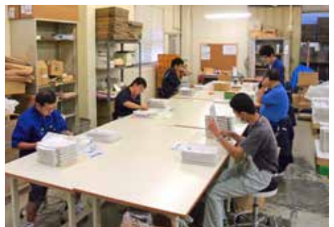
「あゆみ」での作業の様子

「サポートセンターあゆみ」とあわせ2拠点体制で障害者の能力開発に取り組み同社だが、今後は同施設で知識や能力を身につけた利用者、一般企業での就労など、人生を歩んでいく上での選択肢を増やせるような支援を目指している。