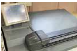
印刷品質を保つための数値管理

て運用を行ったり、制作において作業手順をマニュアル化したり、チェックシートを用いて第三者を含めたダブルチェックを行うなどして、一定の品質を保ちながら、ミスが起きないようルール化しました。