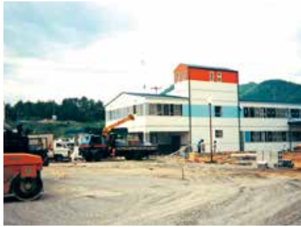
建設中の東広島工場（1990年頃）

キブリントは福祉工場ではない。障がい者も健常者も社員の一人であり、その人にしかできない仕事に取り組み、会社に利益をもたらす存在である」と話している。