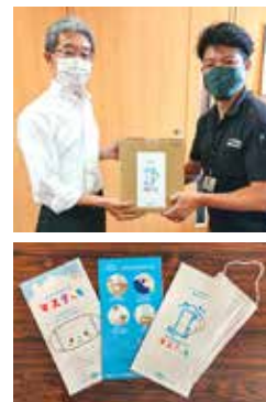
社員が自主的に制作した抗菌マスクケースを寄贈

ありがとう」や「助かります」という感謝の言葉や賞賛をいただいたことは、誠に嬉しいことでありました。