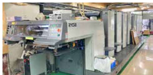
オフセットNON-VOC パウダーレスLED-UV8色印刷機

先にも少し触れましたが、肝心なこととは、顧客のニーズに対応できるかできないか、で終わるのではなく、できるためにどうするか！とただ顧客に寄り添った意識を持って事を成すのか！ということなんです。