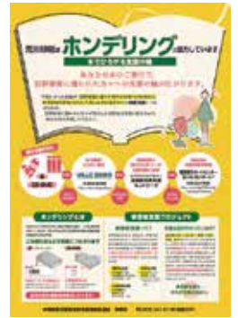
被害者支援プロジェクト「ホンデリング」