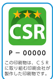
印刷製品へのCSRマーク表示例