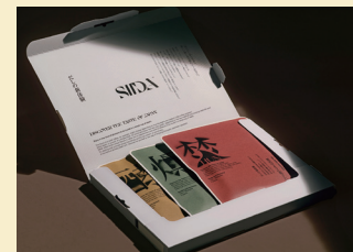
経済産業大臣賞1部門 「SIIDA」/味の素株式会社