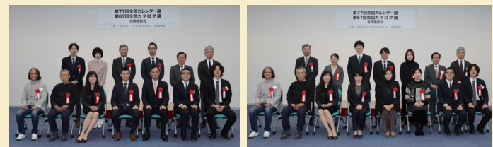
全国カタログ展 受賞者の皆さん 全国カレンダー展 受賞者の皆さん